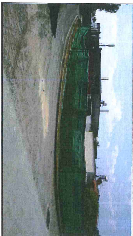
Активито 4 [Теги 724]